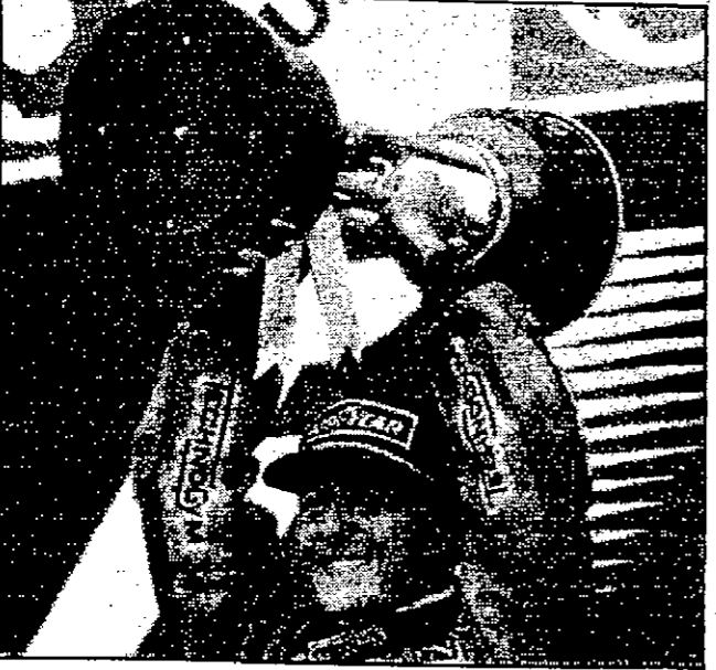
شوماخري يحمل كأس الجائزة الكبرى للسباق الياباني بعد فوزه

لندن - سوزوكا (اليابان) - الشرق الأوسط -